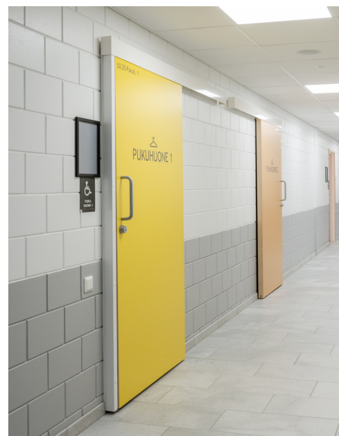
Kuvassa näkyvät pintahelat ovat lisävarusteita